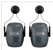
LEIGHTNING 82805 SNR 28 DB