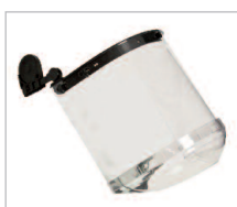
FACEMASTER COMBI Ref. 79209