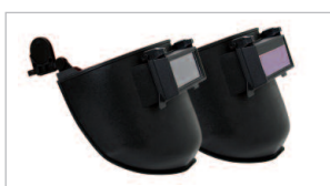
TODOS LOS MODELOS DE CATÁLOGO ACOPLABLES