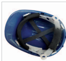
SUSPENSIÓN REF. 80529-SR Suspensión textil de 6 puntos de ajuste