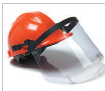
PERFO COMBI AC Ref. 79600