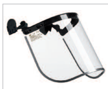
SUPERFACE COMBI Ref. 79710