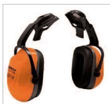
SONICO SET Ref. 82305 SNR 30 DB