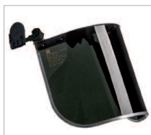
SUPERFACE COMBI GREEN Ref. 79715