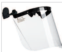
FACY PLUS COMBI Ref. 79712