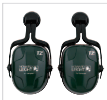
THUNDER T2H 82804 SNR 30 DB