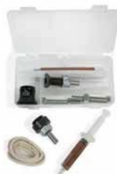
Polish kit para rodillos 9901000016