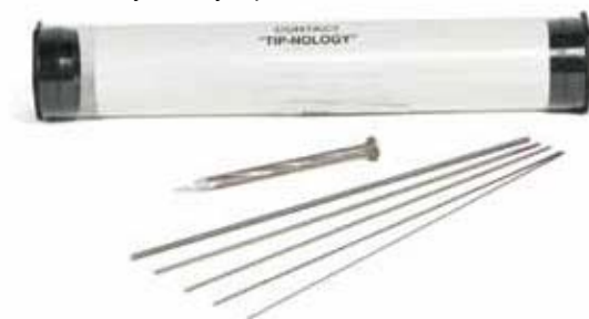
Tipnology Kit 9901000017

El kit "Tipnology" (figura inferior izquierda) es una herramienta para limpiar y sanear las puntas de contacto de las proyecciones y ejes cortantes evitando el afeitado del hilo y el pegado del mismo a la punta. El kit "Polish" (figura inferior derecha) es un conjunto de herramientas para restaurar la superficie de los rodillos de alimentación, los cuales se degradan por los restos superficiales de hilo durante la alimentación y posterior contaminación del conducto hasta la punta de contacto. Muchas veces no pueden apreciarse a simple vista, por lo cual el kit se compone de unas gafas de aumento, herramientas de resanado, una pasta con diamante y una cuerda para pulir y recuperar la superficie de los rodillos. They may not be visible to the naked eye, but yet present on the surface of the wire drive rolls.